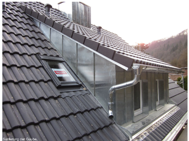
Sanierung der Gaube.