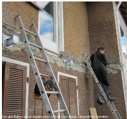
Der alte Balkon wurde abgebrochen und wird von einem zeitgemäßen thermisch