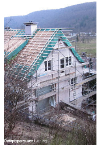
Dampfsperre und Lüftung.