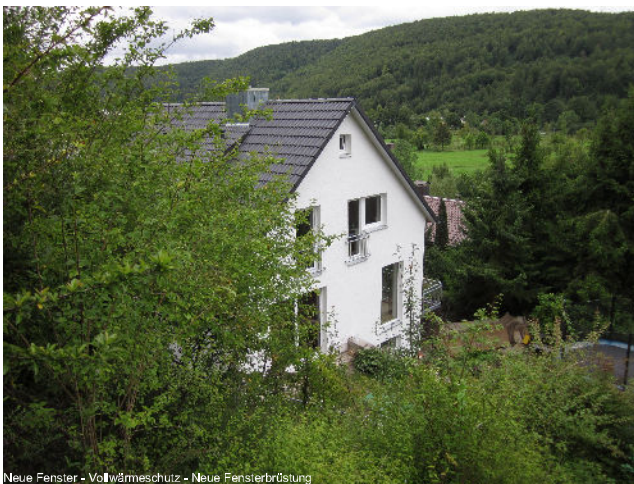
Neue Fenster - Vollwärmeschutz - Neue Fensterbrüstung