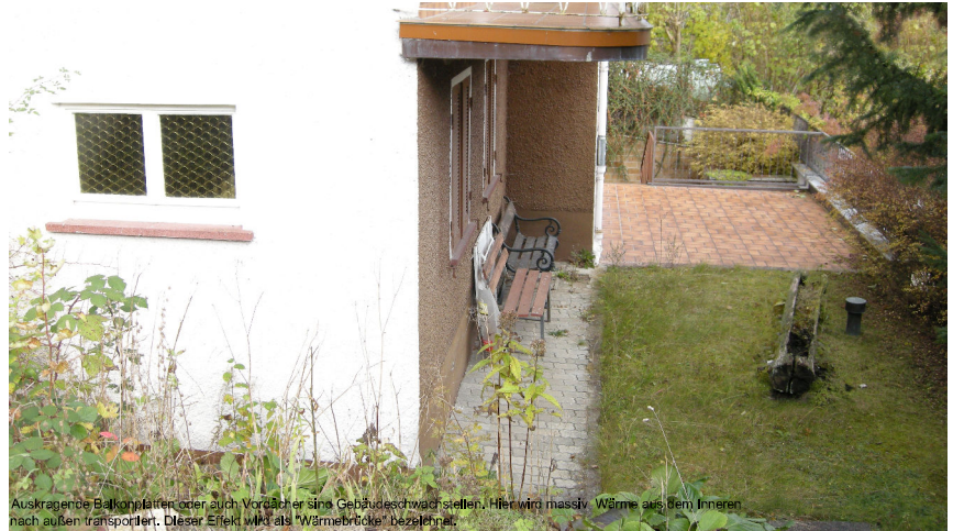
Auskragende Balkonplatten (oder auch Vordächer) sind Gebäudeschwachstellen. Hier wird massiv Wärme aus dem Inneren nach außen transportiert. Dieser Effekt wird als "Wärmebrücke" bezeichnet.